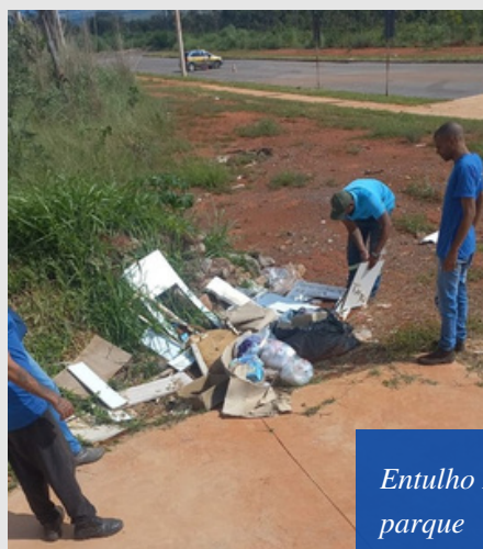
Entulho Itapoã parque

A Administração tem realizado um trabalho incansável para manter a cidade limpa e organizada, com equipes dedicadas à remoção de lixo descartado irregularmente nas ruas. As ações de limpeza ocorrem diariamente, abrangendo diversos pontos da cidade para combater o acúmulo de resíduos e minimizar os impactos negativos ao ambiente urbano.