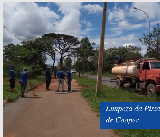
Limpeza da Pista de Cooper