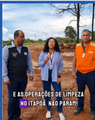
OPERAÇÃO CAPOEIRA DO BALSAMO

AS ÁREAS COM DESCARTE IRREGULAR DE RESÍDUOS URBANOS NO ITAPOÃ ESTÃO SENDO MONITORADAS E RECEBERÃO ATENÇÃO ESPECIAL DA ADMINISTRAÇÃO.