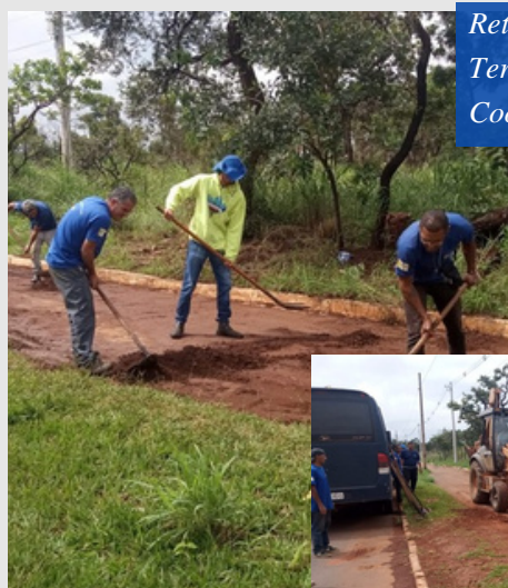
Retirada de Terra: Pista de Cooper