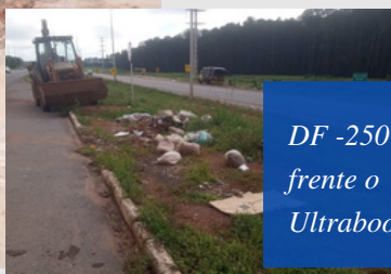
DF -250 em frente o Ultrabook