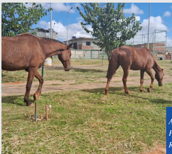
A SEAGRI PROMOVE O RECOLHIMENTO