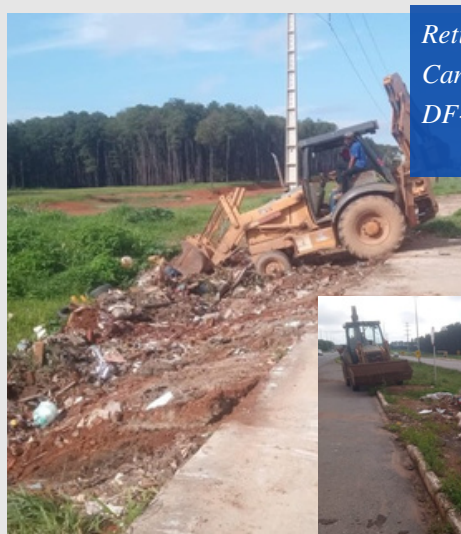
Retirada Entulho Canteiro Central DF-250