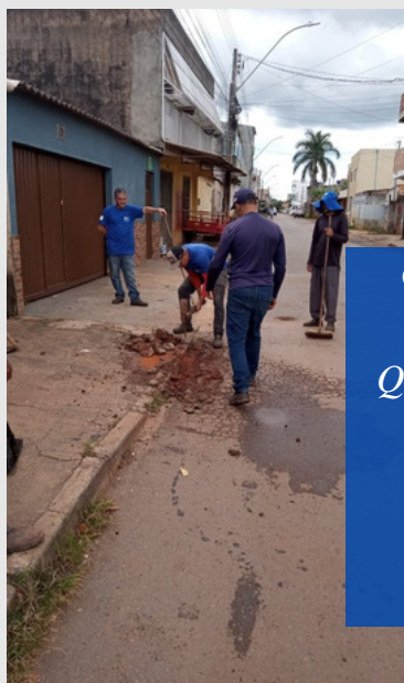
Operação tapa-buracos na Quadra 319, Rua dos Ônibus, próximo ao Comercial do Baixinhoo